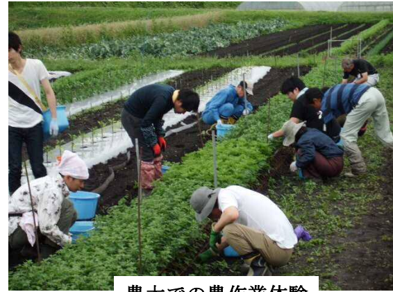
農大での農作業体験

鳥取県で農業を始めようとする方を対象に、 農業大学校の施設見学、農作業体験、新規就農者 の農場視察などを行っていただく研修です。 *ファクシリ又は電子メールでお申し込みください。