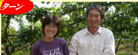
やる気と自立心こそ大事