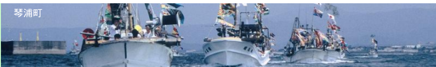
琴浦町は漁業も盛んなまち。赤碓港は、ハマチ、白イカ、アジなど新鮮な海の幸が水揚げされる