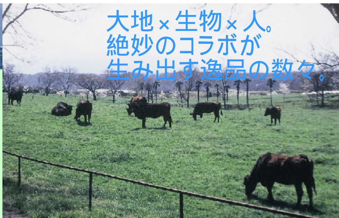
和牛が放牧される町の南部にある牧草地。大山山系の船上山を望む悠久の世界が広がる