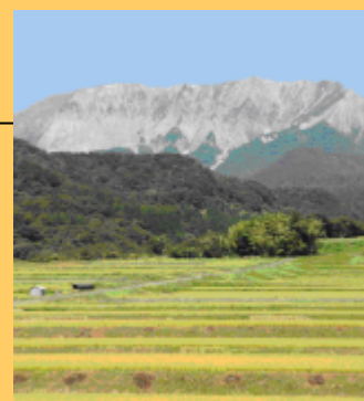
農地から大山の南壁が望める