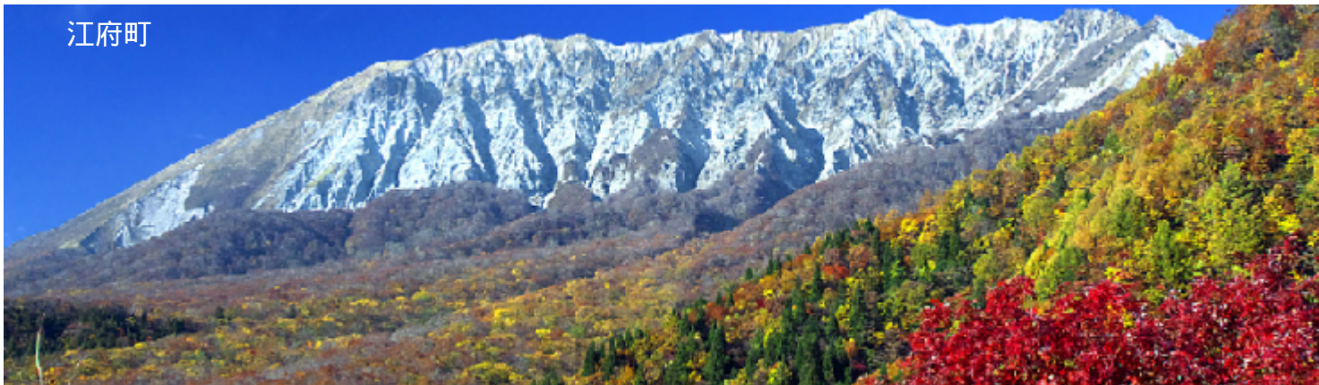
大山の南側は「奥大山」と呼ばれ、荒々しい山容が特徴。秋は中腹のブナ林の紅葉と山頂の冠雪との対照が見事だ