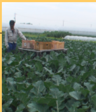
ブロッコリーは初夏と秋冬に収穫